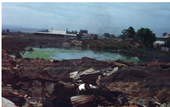
> Figura 1. Contaminación por residuos sólidos y líquidos en el sector industrias pesqueras de la Isla Rocuant, Talcahuano, 1995.

alcances de los procesos de deterioro ambiental en la ciudad, sino también a iniciar el diseño de un plan de acción que permita, en el mediano plazo, ir superando las dificultades existentes en este sentido (Valenzuela, 2002).