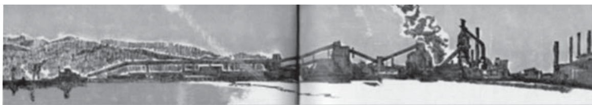
> Figura 3. Croquis promocional de la zona industrial de Talcahuano. Representación de la Siderúrgica Huachipato de la CAP, 1963.

Desde esta perspectiva, es preciso situar y ponderar el sentido y alcance de los IPT y otros instrumentos orientados a la gestión del desarrollo, incluyendo el ambiental y territorial. En estricto rigor, ellos siguen situados en el discurso desarrollista en la medida que aspiran a proseguir el inconcluso camino trazado por el discurso