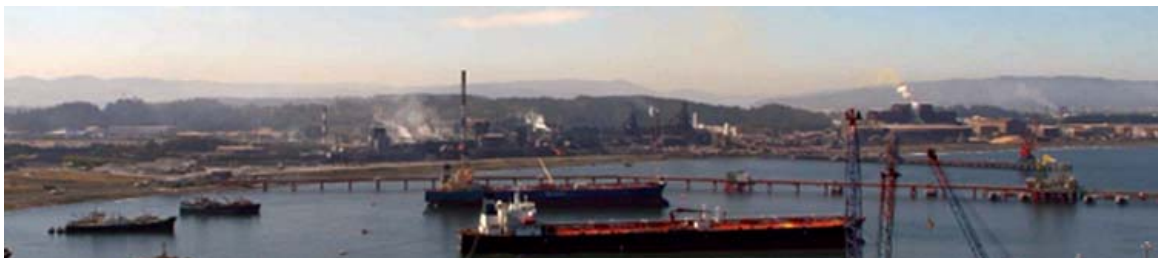
> Figura 4. Bahía San Vicente y Siderúrgica Huachipato hoy, vista desde el cerro Caracol, Talcahuano.