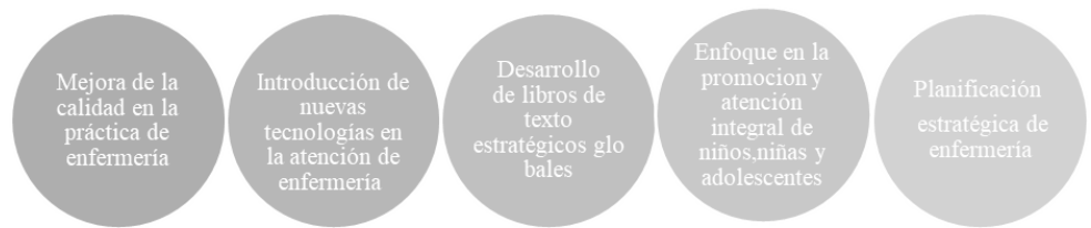
Figura 4: Tendencias de investigación en enfermería en Honduras