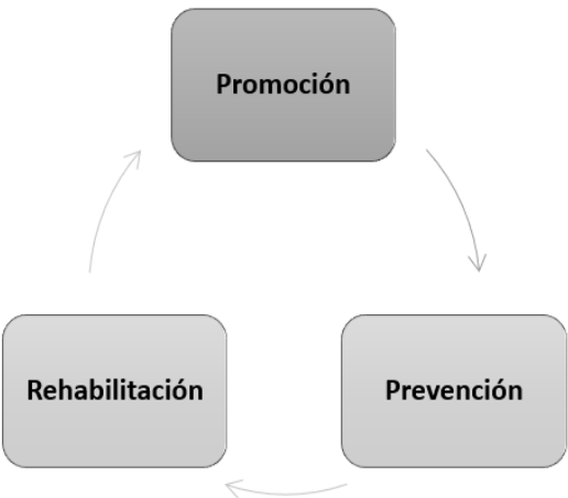
Figura 1: Ejes estratégicos de la investigación de Enfermería en Honduras