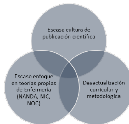
Figura 2: Retos que enfrenta la investigación en enfermería en Honduras

De acuerdo a lo analizado previamente, existe una disociación entre la formación en investigación en enfermería y la práctica clínica, donde muchos profesionales se sienten inseguros al desarrollar estudios, por falta de mentoría o metodologías adecuadas. (30) En este sentido, se identificaron retos que enfrenta la investigación en enfermería en Honduras (Figura 2), los cuales se deben principalmente a dos aspectos: la deficiente formación en metodología de investigación en la docencia y una mayor formación en epidemiología, gerencia de salud y salud pública en la docencia, lo que genera desarrollo de la investigación en otras disciplinas lo que podría considerarse una fortaleza al combinarlo en un trabajo colaborativo, pero se convierte en una de las principales amenazas cuando no se incluye en las perspectivas de investigación el aporte de enfermería. (31)