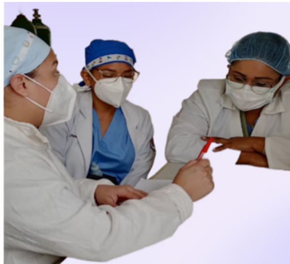
Figura 3: Ilustración de enfermeras hondureñas aplicando investigación en políticas públicas

Es necesario que la investigación que realicen las enfermeras, generen un impacto en la solución de problemas nacionales y en políticas públicas. A nivel nacional, las políticas públicas contribuyen en la mejora de la salud y el bienestar de la población, para ello se necesita un liderazgo basado en evidencia, donde – cabe destacar- a nivel histórico resaltan la participación de enfermeras en la creación de estas, como por ejemplo en la identificación de los niveles de violencia en niños y adolescentes, así como en cuidados paliativo (Figura 3). (31,32) Se espera que al articular la investigación con la práctica clínica se pueda tener una mejora en la calidad asistencial y que los hallazgos obtenidos de la investigación sean aplicados a las políticas públicas en salud para que estas sean alineadas con las necesidades de la población.