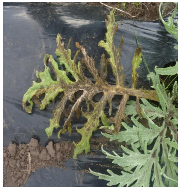
Figura 1. Síntomas a campo de alcaucil ( Cynara scolymus L).

Los síntomas fueron manchas acuosas y hundidas en hojas y brácteas que se vuelven blandas en plantas de alcaucil (Figura1). El patógeno puede afectar tallos, raíces o estolones y producir marchitamiento de la planta en general. La infección progresa hacia abajo. En órganos carnosos, genera una podredumbre blanda que provoca la pérdida de consistencia de las partes afectadas. El tejido cambia de coloración pasando de color verde a marrón y aparece un olor característico que se torna desagradable cuando los órganos afectados son invadidos por bacterias secundarias. El ablandamiento y pérdida de agua de los órganos da como resultado la formación de una masa mucilaginosa formada por los tejidos y las bacterias.