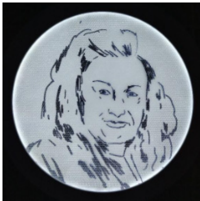
Foto 6: Detalle de los dibujos de los rostros de las integrantes del sindicato, en 23 años del Sindicato Afrodita (2023).

Estas creaciones dialogan particularmente con la línea de investigación sobre violencia de género del proyecto Anillos, la cual tiene como objetivo identificar los procesos subyacentes a las altas cifras de violencia contra las mujeres y personas LGBTQ+ en la ciudad de Valparaíso, y a la marginalización y silenciamiento de la violencia de género experimentada por personas Rapa Nui, en especial, mujeres y comunidades LGBTQ+. La representación de la violencia en la costura colectiva, en las imágenes y la instalación de retratos lumínicos enriquecen el tradicional formato académico de artículos científicos para difundir conocimiento.