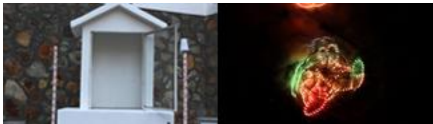
2. Frames video Más Power , disponible en: https://vimeo.com/156125698 .