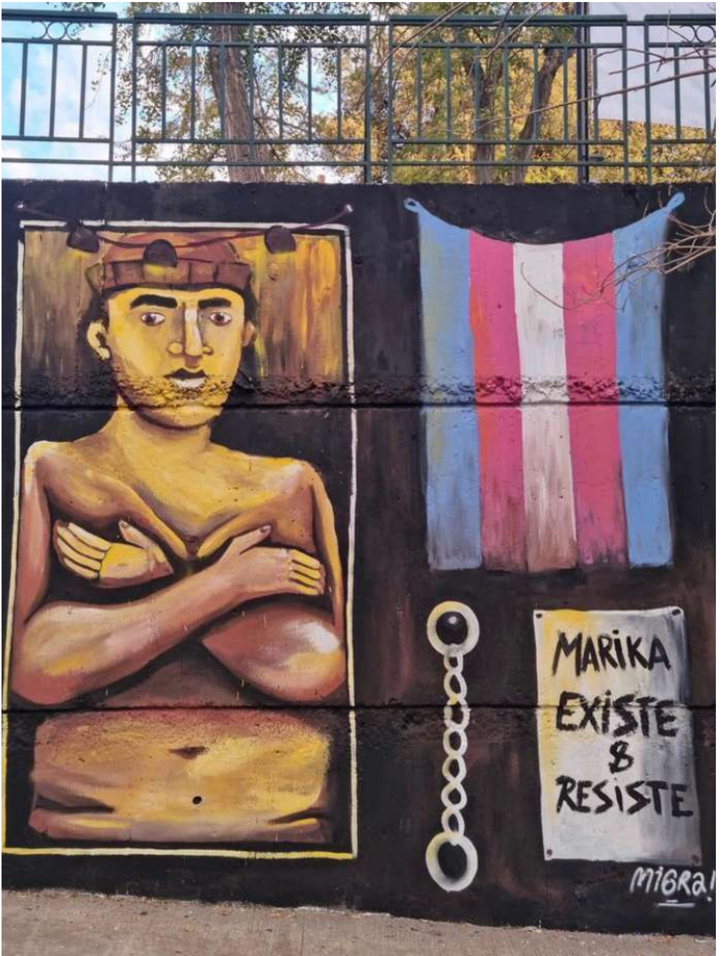
Marika existe y resiste – Santiago, 2022