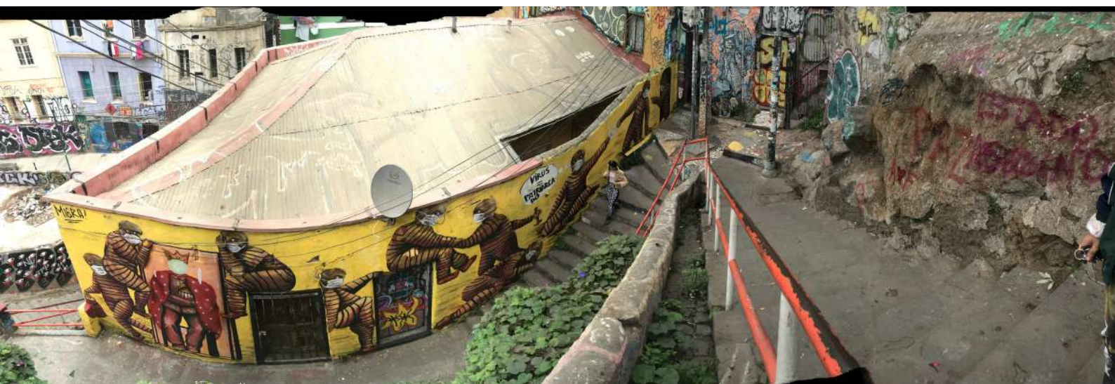
Virus = Patriarcado – Valparaíso, 2020