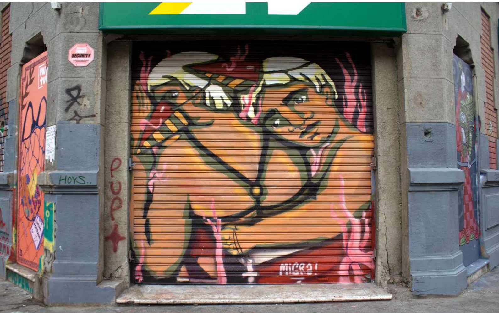
Quererte – Valparaíso, 2023.