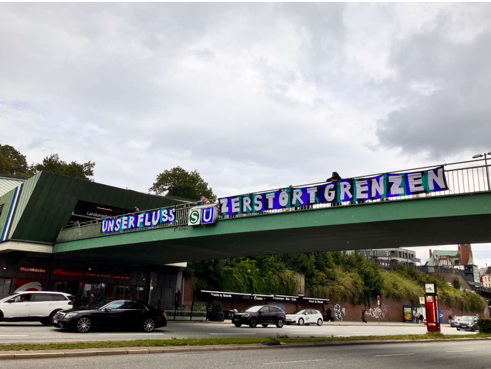
Unser fluss zerstört grenzen - Hamburgo, 2023.