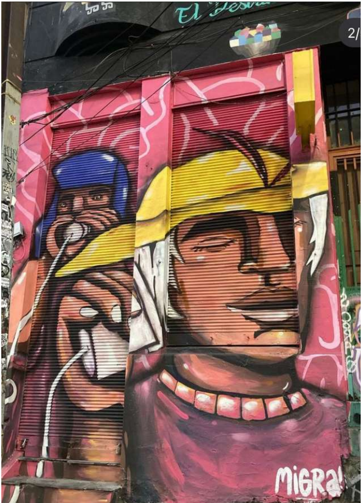
El teléfono – Valparaíso, 2022