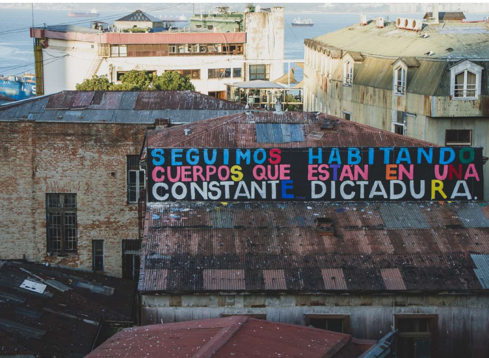
Seguimos habitando cuerpos que están en una constante dictadura. – Galería Judas, 2023