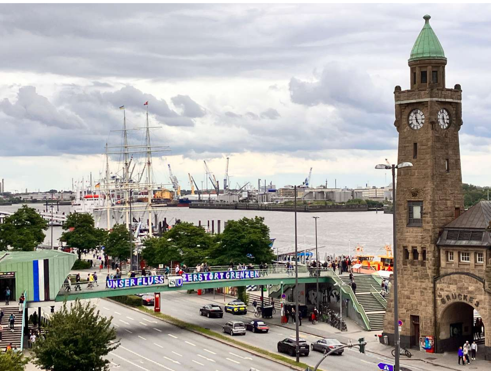
Nuestro cause romperá fronteras – Hamburgo, 2023.