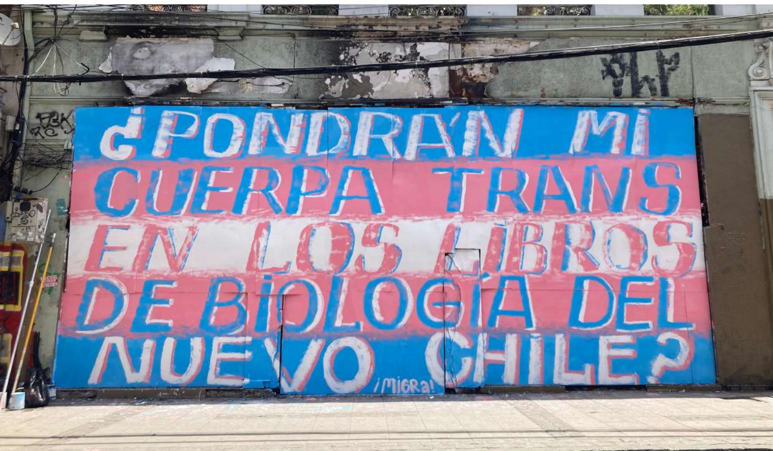
¿Pondrán mi cuerpo trans en los libros de biología del nuevo Chile? – Valparaíso, 2022.