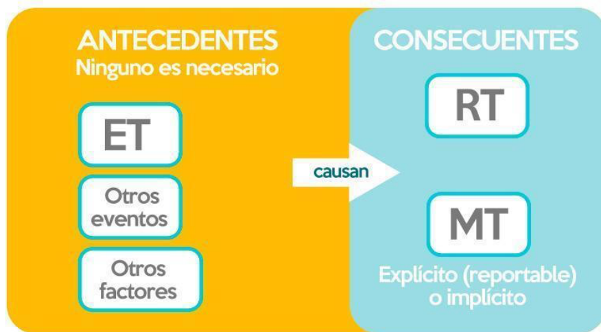
Imagen 2: Visión postcausal del trauma psicológico

La visión causal fuerte del trauma asume, como he discutido, una relación causal fuerte entre el ET, la MT y la RT en la definición de trauma psicológico. En esta relación, el ET es antecedente, y la MT y la RT son consecuentes. Me parece que esta visión debería ser superada debido a que la relación causal que supone es problemática y no explica de forma suficiente efectos relevantes presentes en el trauma psicológico (como los que expliqué en la sección 3). En su lugar deberíamos preferir una relación de causalidad débil donde se contemple al ET (singular o repetido) como uno de los múltiples factores 13 que dan origen a MTs y RTs. En esta, la causalidad está distribuida entre múltiples factores antecedentes con distintos niveles de injerencia en el consecuente. Tal relación puede verse así: