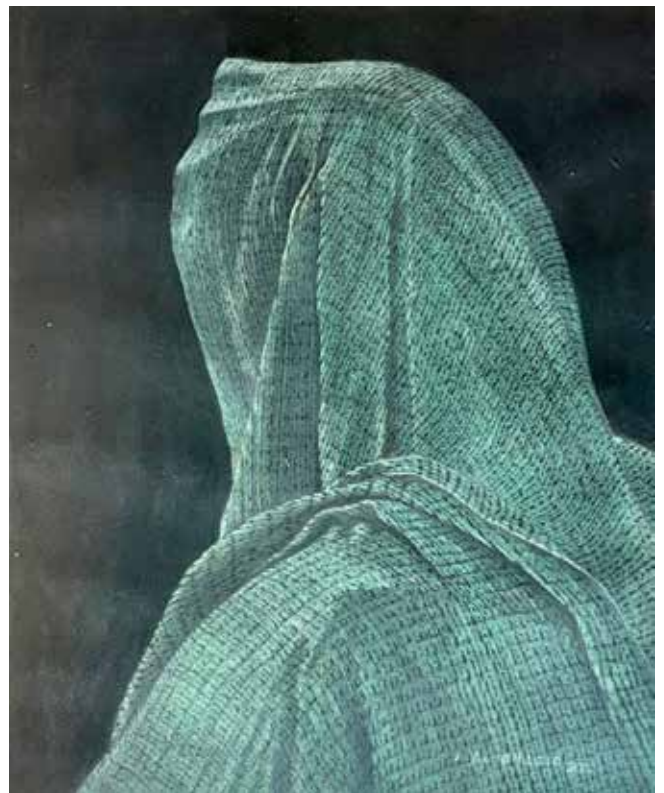
Figura 1. Pintura óleo Ministerio.