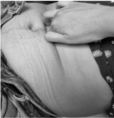
Fig. 2. Medición en la línea alba supraumbilical.